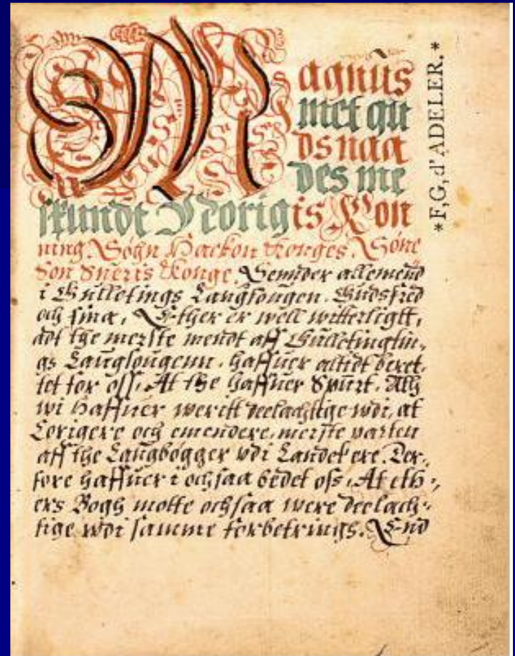
Magnus lagabøtes landlov fra 1276

Likhet, sosial rettferdighet og kommunikativ rasjonalitet